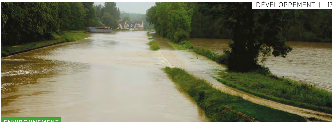
La crue de 2016, au niveau de l'écluse de la Tuillerie.