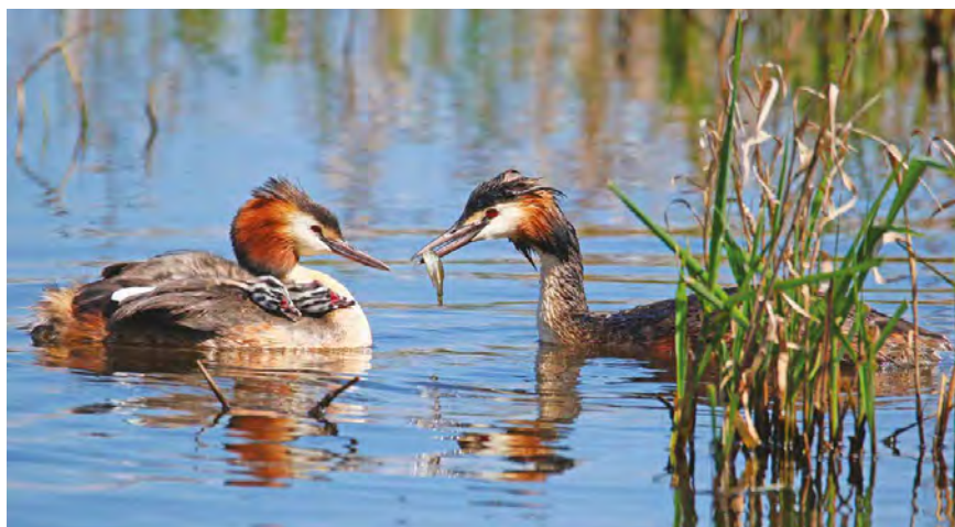
Grèbes huppés. Photographie de Michel Pécher à découvrir dans son exposition (lire en cahier central).

sorties ornithologiques à l'espace naturel sensible, où deux observatoires ont été construits autour de l'étang des Népruns. Prochain rendez-vous le dimanche 20 mai ! (Informations pratiques dans le cahier central).