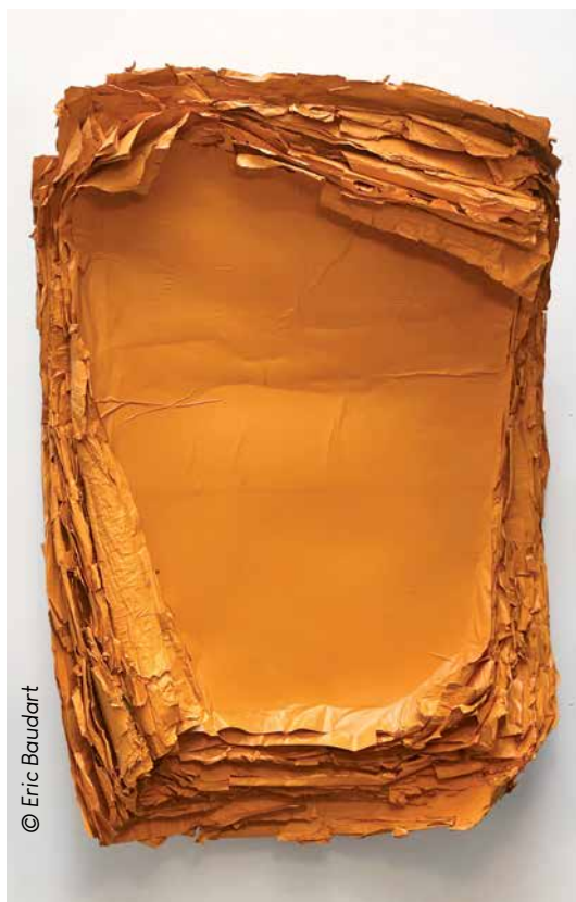
conCav Orange 03, 2019w acier, papier, peinture, résine 220 x 130 x 45 cm

"Figure(s)", nouvelle saison à découvrir dès le 5 octobre