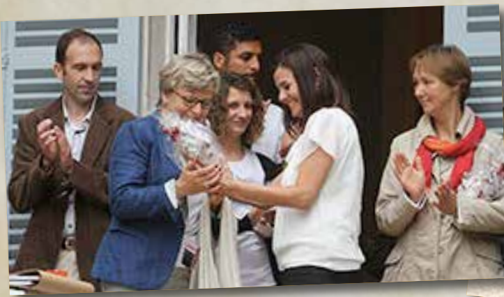
Échanges de cadeaux entre les officiels européens accompagnés des trompes de chasse des Invités de Saint-Hubert.