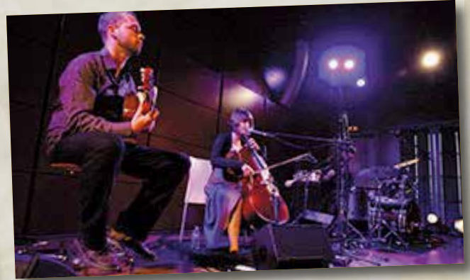
Atmosphère envoûtante à la médiathèque avec Madera Em Trio...