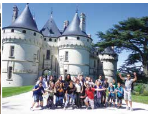
Visite au château de Chaumont.