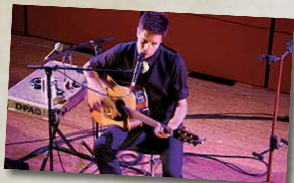
... et Jekyll Wood.