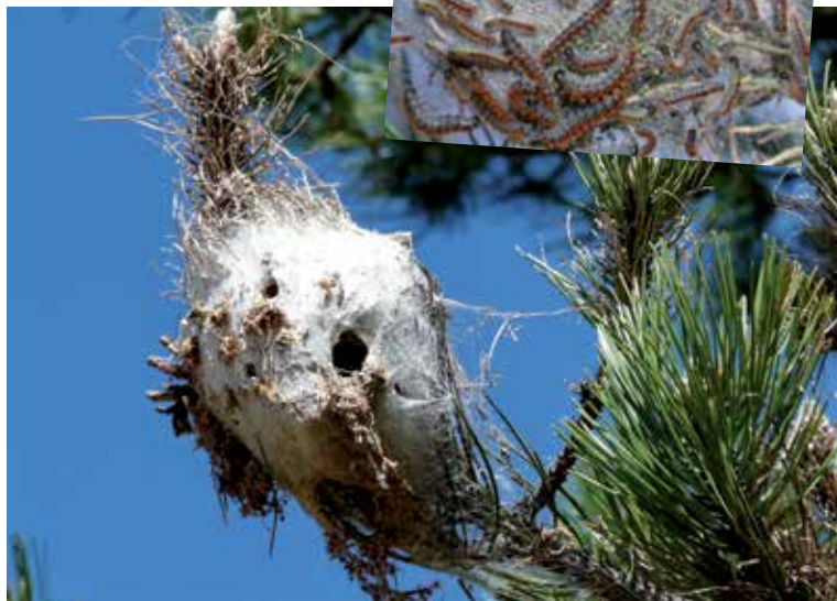
Cocon accroché dans un pin.

autres, en procession (d'où le nom donné à l'insecte) et s'enterrent avant de se transformer en papillon. En juillet, ces papillons (de nuit) sortent du sol pour s'accoupler et pondent sur les aiguilles de pin. Le cycle est alors bouclé.