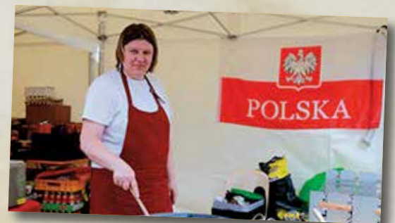
Stands européens et d'autres horizons...