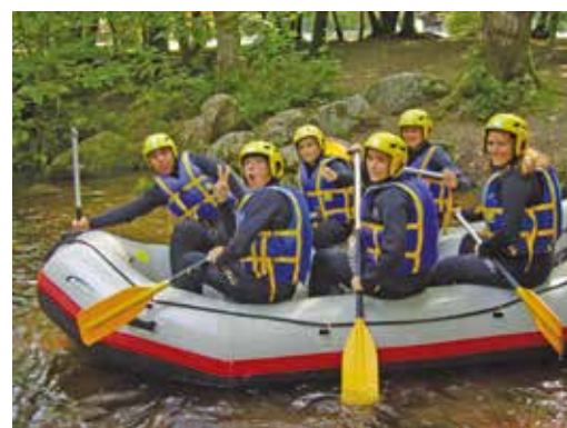
Surf sur un torrent d'activités !