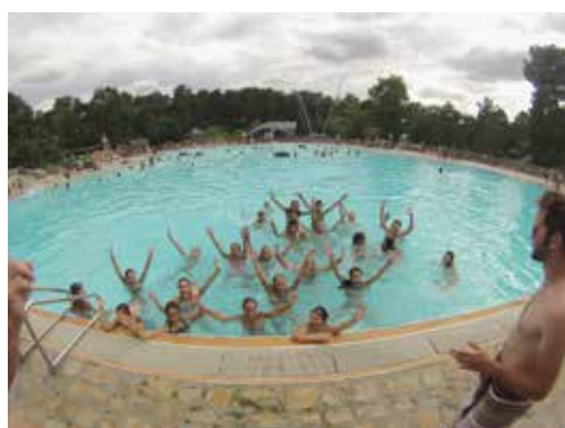
Baignade à Buthiers.

Site internet : www.amilly.com (rubrique jeunesse)