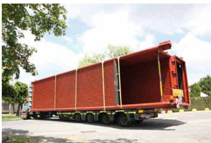
La livraison du premier tiers de la chaudière.