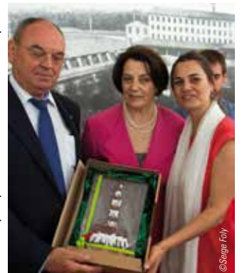
Echange de cadeaux lors du repas.

Le dimanche, tous les participants et invités se sont retrouvés autour d'un repas officiel, le temps d'un échange de cadeaux et de messages de fraternité pour une Europe forte et unie. Puis, ce fut le moment du départ avec des remerciements et l'envie de revenir l'année prochaine. 🌸