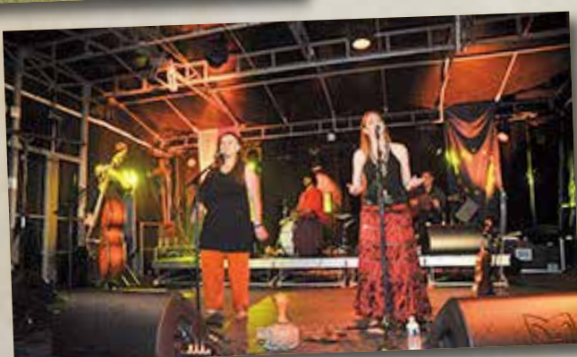
Soirée finale orchestrée par le groupe polonais Dikanda...avant d'assister au toujours spectaculaire feu d'artifice.