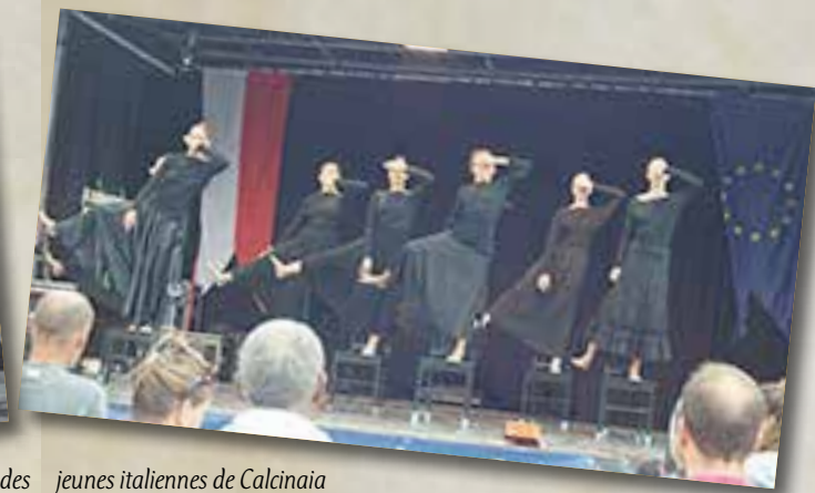
des jeunes italiennes de Calcinaia