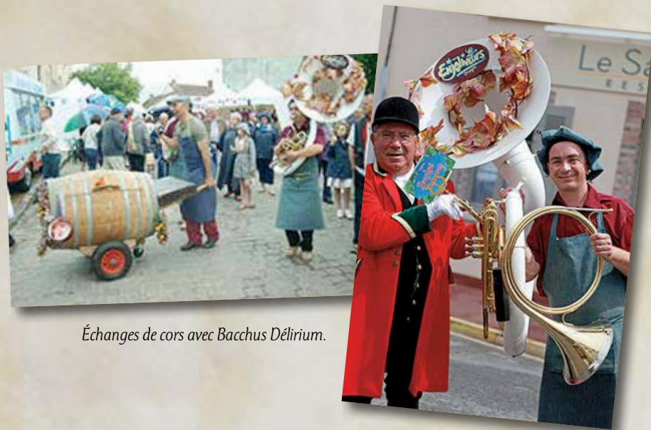
Échanges de cors avec Bacchus Délirium.