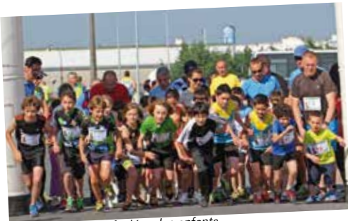
Départ des foulées des enfants.

En ce premier dimanche de juin, sous un soleil radieux, 274 coureurs et 130 marcheurs se sont réunis pour partager un instant sportif. Au programme, un 1000 mètres et un 2000 mètres pour les enfants, un 5 kilomètres et un 10 kilomètres course ainsi que la nouveauté de cette année, le 10 kilomètres marche. Pour les marcheurs les plus curieux, une initiation à la marche nordique était organisée. À l'arrivée des courses et de la marche, le ravitaillement a comblé chaque participant. Chacun d'eux est d'ailleurs reparti avec un lot de production locale. Merci aux organisateurs, aux bénévoles et aux sportifs. Rendez-vous le 7 juin 2015 au stade Georges-Clériceau pour la 4 e édition de la Bell' d'Amilly !