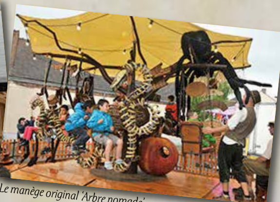
Le manège original 'Arbre nomade'.