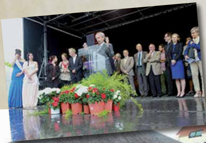
Inauguration officielle avec les portedrapeaux des dix pays, déjà invités à Amilly.