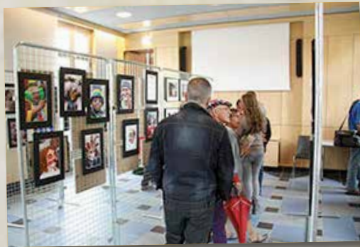
Exposition photographique des villes jumelles avec le concours du Photo Club.