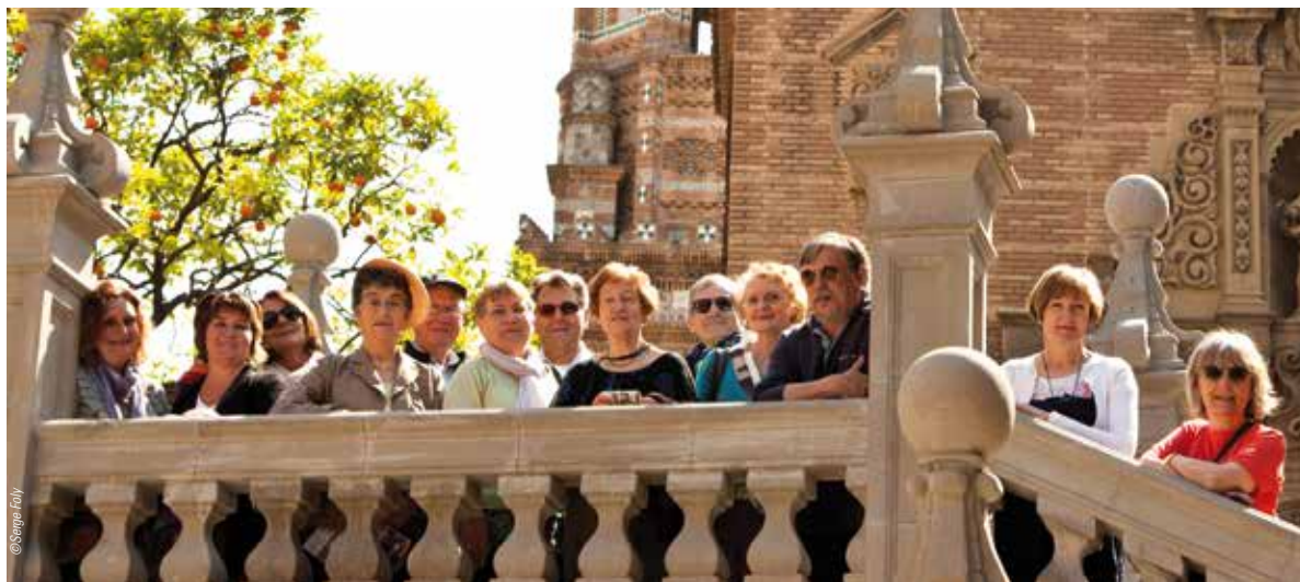
L'ENSEMBLE DES PARTICIPANTS AUX COURS DE CONVERSATIONS DU 8 AU 11 MAI EN ESPAGNE

D ans le cadre de ses jumelages avec Vilanova del Cami (Espagne) et Calcinaia (Italie), la Ville organise, depuis plusieurs années, des cours de conversations pour adultes afin de se familiariser avec la langue du pays. Pour la première fois, la Ville a donc permis à neuf élèves de mettre en pratique leurs cours d'espagnol durant le week-end du 8 mai. En pleine immersion dans la vie quotidienne, tant chez les familles d'accueil qu'au cours de leurs visites touristiques, nos "hispanisants" ont pu tester leurs capacités.