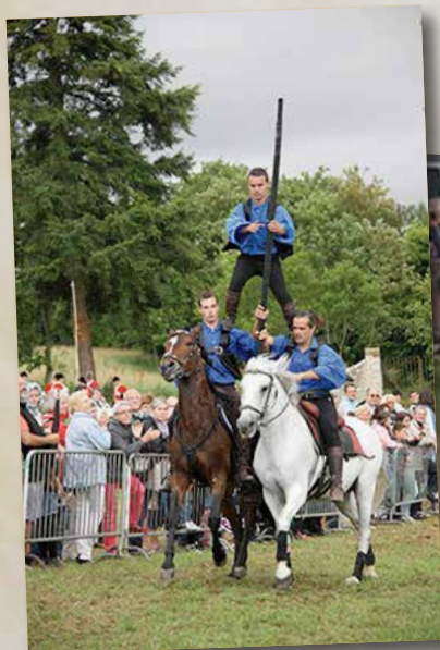
Un public nombreux pour les cascades et les voltiges de la Compagnie Cheval Spectacle.