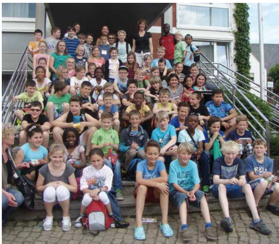
LES JEUNES AMILLOIS ET LEURS CORRESPONDANTS.

Ce fut donc une semaine extraordinaire qui a pu avoir lieu grâce à l'accueil chaleureux de tous les partenaires de Nordwalde et au service jumelage d'Amilly. 🌸