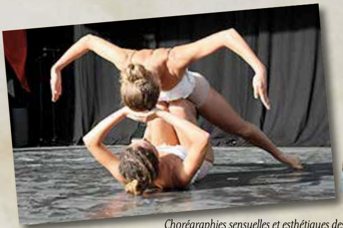
Chorégraphies sensuelles et esthétiques des jeux