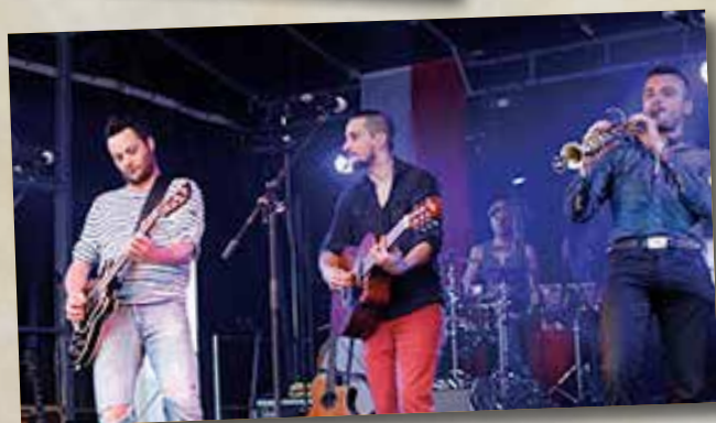
Les Yeux D'la Tête ont enflammé la Place de Nordwalde.