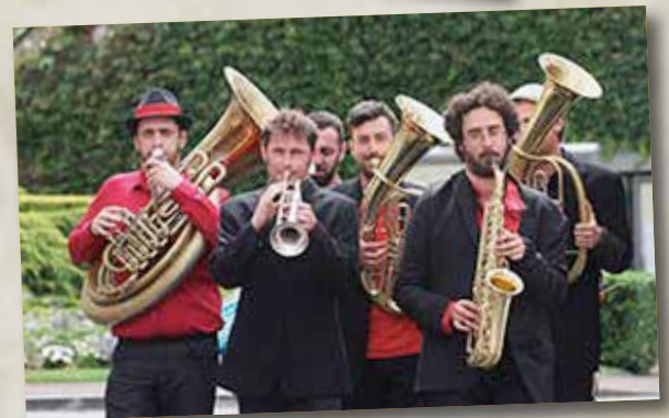
La Fanfare Redstar Orkestra.