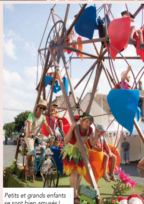
Petits et grands enfants se sont bien amusés !