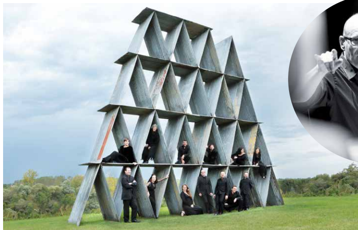
Ensemble Jacques Moderne, premier concert de la saison, vendredi 14 septembre.