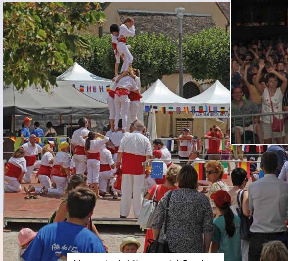
Nos amis de Vilanova del Camí ont fait la démonstration de leurs talents.