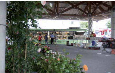
Le marché Place de l'Église les dimanches de 8h à 13h - P.12