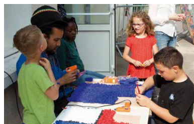
Les enfants des accueils périscolaires ont réalisé les éléments du char- P.15