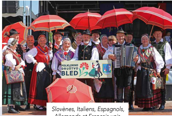
Slovènes, Italiens, Espagnols, Allemands et Français unis dans la diversité.