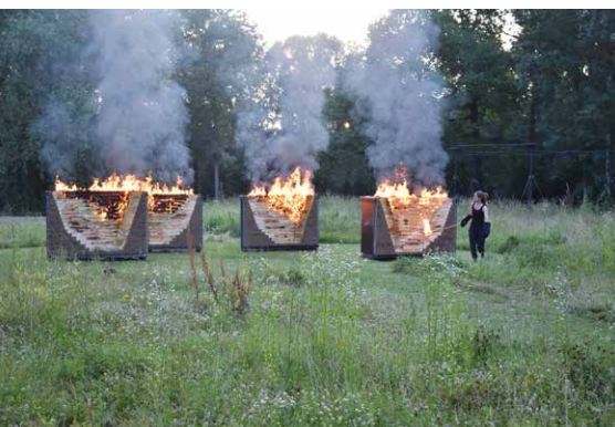
Cuisson des modules en terre de l'installation Rituel Reality pour la Grande halle.

Renseignements et inscriptions à l'Office de tourisme, 02 38 98 00 87