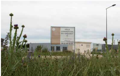
Le pôle commercial du Chesnoy sort de terre - P.08